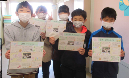
笑顔いっぱいの6年生

新聞乗りジャンケンやフルーツバスケット、ハンカチ落とし等、どの教室からも、学年関係なく、班の仲間とゲームを楽しむ声が聞こえました。