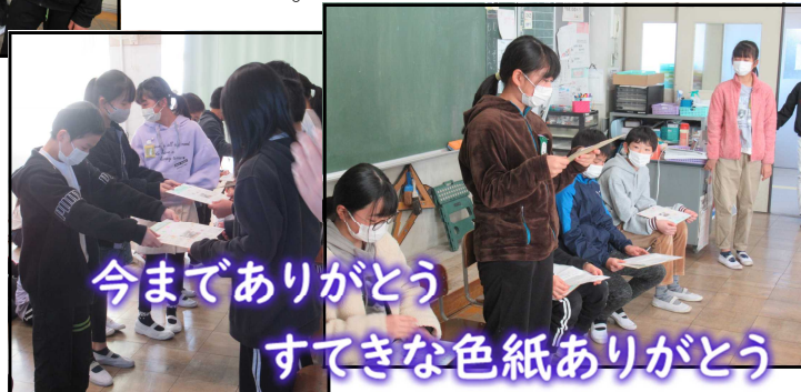
今までありがとう

最後はプレゼント(班の仲間からのメッセージと班の仲間と撮った写真が貼ってある色紙)を6年生に渡しました。心のこもったメッセージを読んで6年生はとてもうれしそうでした。また、渡した色紙をうれしそうに眺める6年生を見て、5年生を初めとする在校生も笑顔になりました。