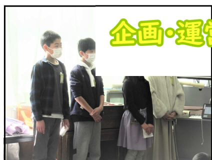
企画・運営をした5年生

2月22日(水)3時間目、なかよし班のリーダーに感謝の気持ちを伝える「6年生に感謝する会第1弾」が行われました。企画、司会進行は、来年度リーダーとなる5年生。