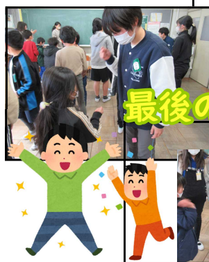
最後のなかよし遊び

会の前半は、6年生との最後のなかよし遊びとして、各班で工夫した遊びを行いました。できるだけ6年生とふれあえるように、班のみんなが楽しめるようにと、5年生が考え、準備をしてくれました。